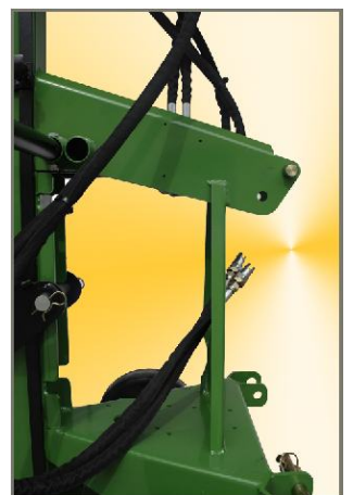
Ausstattung: Hydraulischer Anschluss an Zugmaschine