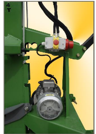
Ausstattung: Dreiphasen Elektromotor