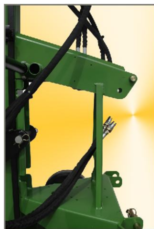
Ausstattung: Hydraulischer Anschluss an Zugmaschine