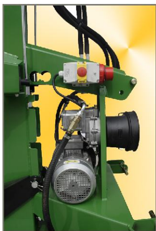
Ausstattung kombiniert: Zapfwellenantrieb Dreiphasen Elektromotor