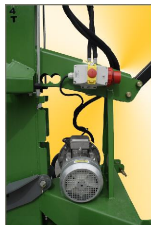
Ausstattung: Dreiphasen Elektromotor