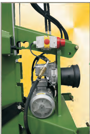
Ausstattung kombiniert: Zapfwellenantrieb Dreiphasen Elektromotor