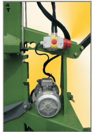
Ausstattung: Dreiphasen Elektromotor