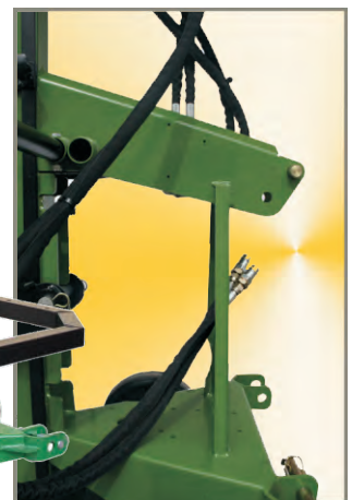
Ausstattung: Hydraulischer Anschluss an Zugmaschine